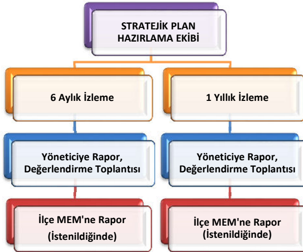
Şekil 2 İzleme ve Değerlendirme Süreci

Kurumumuzun 2019-2023 Stratejik Planı İzleme ve Değerlendirme sürecini ifade eden İzleme ve Değerlendirme Modeli hazırlanmıştır. Kurumumuzun Stratejik Plan İzleme-Değerlendirme çalışmaları eğitim-öğretim yılı çalışma takvimi de dikkate alınarak 6 aylık ve 1 yıllık sürelerde gerçekleştirilecektir. 6 aylık sürelerde Kurum Müdürüne rapor hazırlanacak ve değerlendirme toplantısı düzenlenecektir. İzleme-değerlendirme raporu, istenildiğinde İlçe Milli Eğitim Müdürlüğüne gönderilecektir.